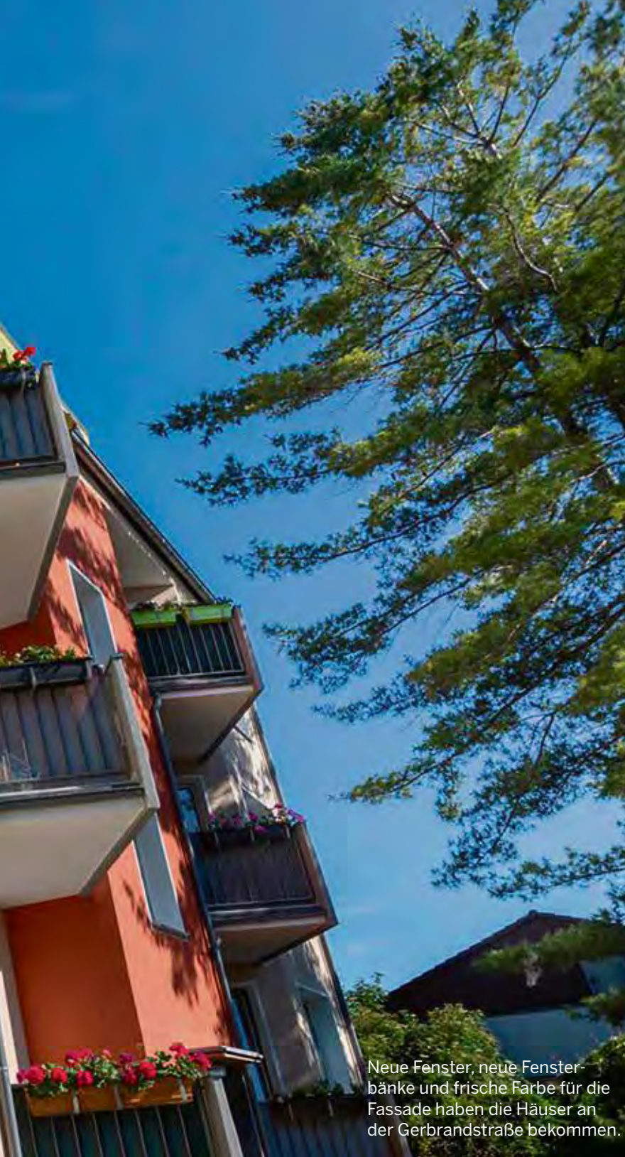
Neue Fenster, neue Fensterbänke und frische Farbe für die Fassade haben die Häuser an der Gerbrandstraße bekommen.

Das Heimatwerk hat auch in diesem Jahr, trotz der Corona-Pandemie, alle geplanten Modernisierungs- und Instandhaltungsmaßnahmen durchgeführt.