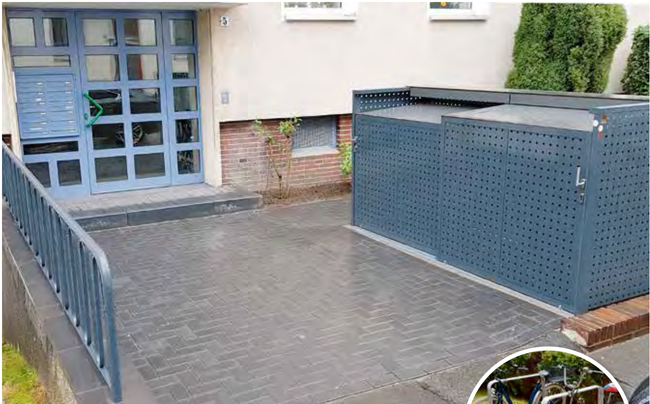
An der Hallerstraße wurden die Mülltonnen mit einer abschließbaren Einhausung versehen. Außerdem wurden stabile Fahrradbügel aufgestellt.

Kunststofftüren ersetzt. Alle Hauseingänge sind nun auch bei Dunkelheit besser auffindbar: Sie erhielten beleuchtete Hausnummern, die direkt über Solarstrom betrieben werden.